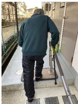
自宅前の段差昇降練習