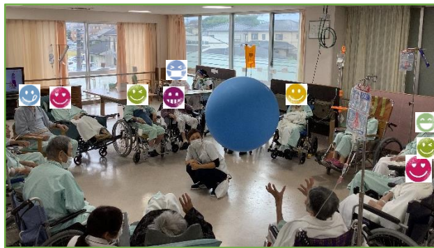
風船バレーの様子

やはり病棟ごとに患者さん層が異なるため、同じ方法では「出来ない・上手くいかない」ということもあります。今後も工夫を重ね、先行導入の病棟の様により患者さんのためになる集団リハビリを目指していきます！