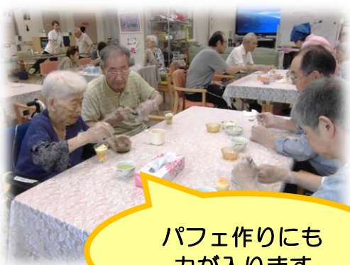
パフェ作りにも 力が入ります