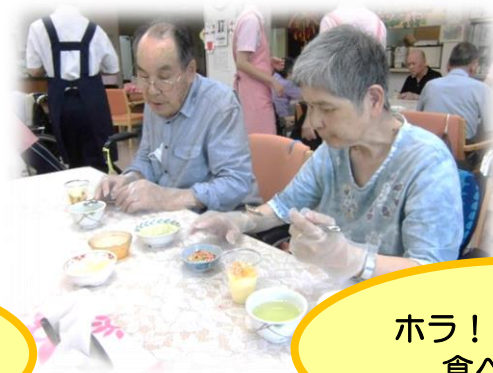
ホラ！おいしいよ 食べる??