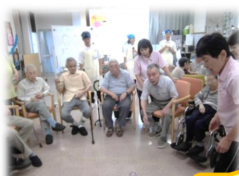
みんなで一緒に「故郷」を 歌いました。