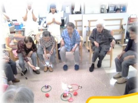
高校生のみなさんが考えたゲーム “脱出させよ”をみんなで楽しみました