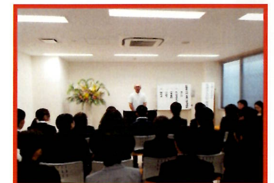
理事長からの激励を受ける新職員

平成27年度の辞令交付式が行われ、本年度は、看護職3名、介護職8名、作業療法士3名、事務職4名、社会福祉士2名の入職があり恵成会の仲間入りをしました。