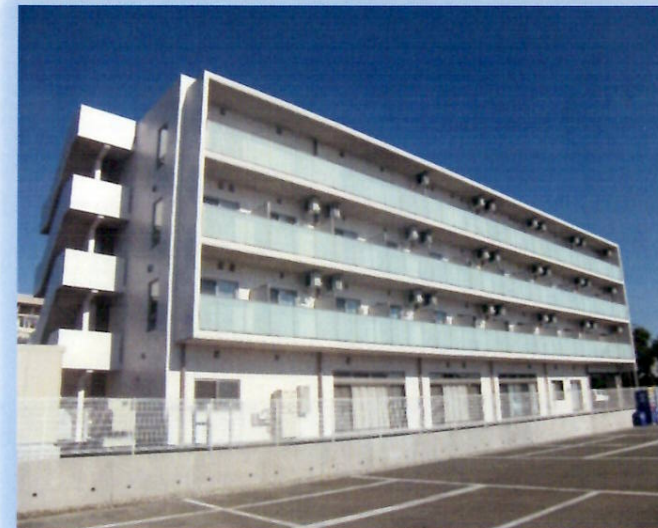
4階建ての機能的・居住空間の美しさを重要視した建物