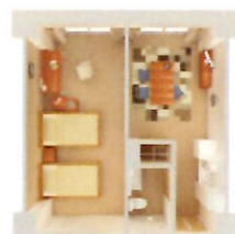
各室冷暖房完備、水洗トイレ、TV共聴アンテナ、洗面台