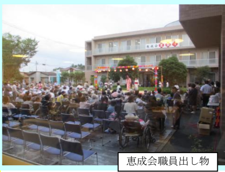
恵成会職員出し物