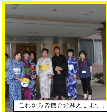
これから皆様をお迎えします：職員

訂正のお知らせ：えいせい通信8月号の中で一部誤りがありました。回復リハビリテーション病棟オープンが24年4月と なっておりましたが25年4月オープンの誤りです。訂正とともに謹んでお詫び申し上げます。