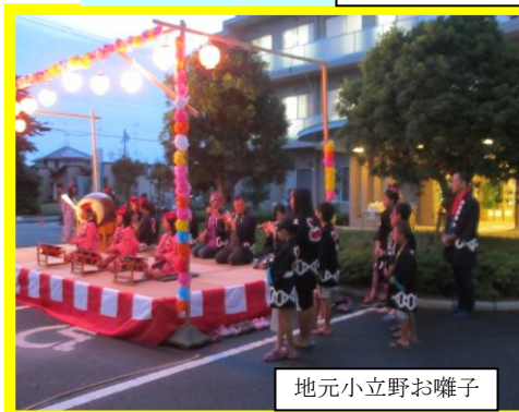
地元小立野お囃子