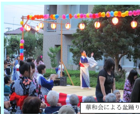
華和会による盆踊り