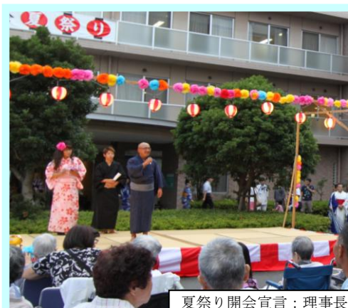
夏祭り開会宣言：理事長

えいせい病院恒例夏祭りが7月28日(えいせい掛川)、8月18日(えいせい病院)にて華やかに開催されました。利用者様とスタッフがともに楽しめる夏祭りは毎年盛大に行われます。盆踊りやお囃子の調子に合わせてご家族とともに楽しい夏のひと夜を過ごしました。