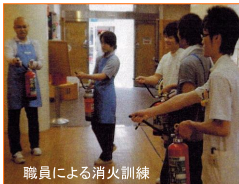
職員による消火訓練