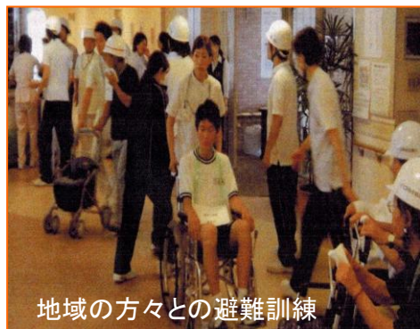
地域の方々との避難訓練

来年もまたよろしくお願ひします。当院では、昨年の東日本大震災を教訓に防災計画・マニュアルをすべて見直し、より実践的な計画・マニュアルを作成して毎月2回防災訓練を実施し、来る南海トラフ大地震に備えております。今後も職員全員防災意識を高め、訓練のための訓練にならないよう緊張感を持って取り組んでいきたいと考えています。